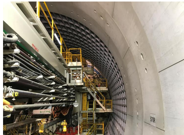
② 高速 5 号線シールドトンネル掘削他工事