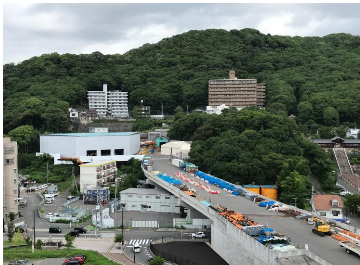
① 高速 5 号線シールドトンネル掘削他工事