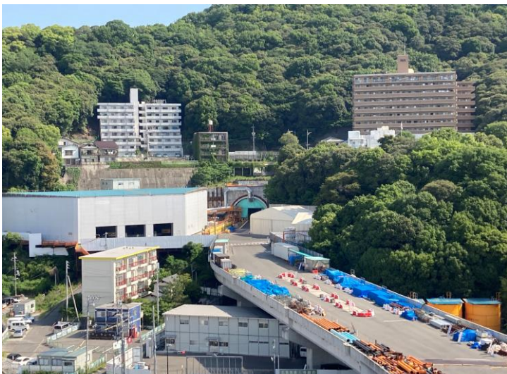
① 高速 5 号線シールドトンネル掘削他工事