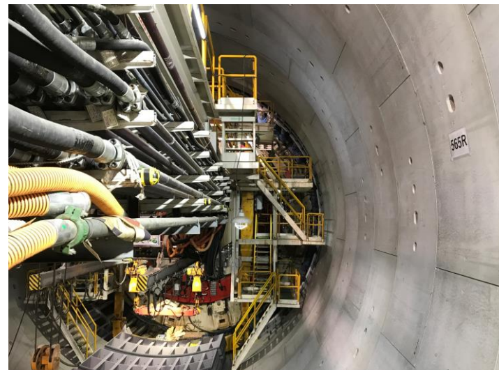
② 高速 5 号線シールドトンネル掘削他工事