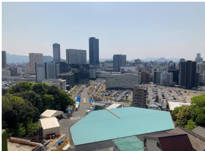
① 高速 5 号線シールドトンネル掘削他工事