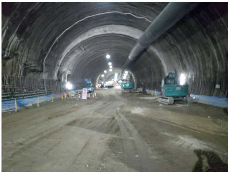
③ 高速5号線 NATM トンネル工事