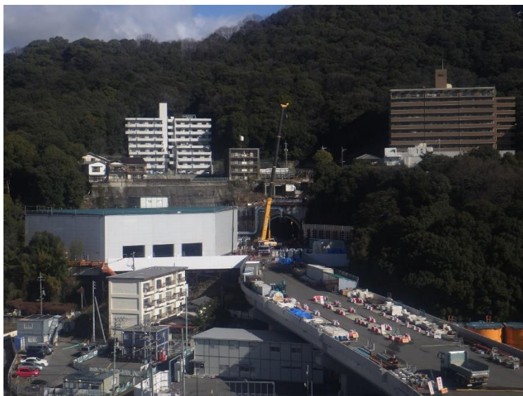
① 高速5号線シールドトンネル掘削他工事