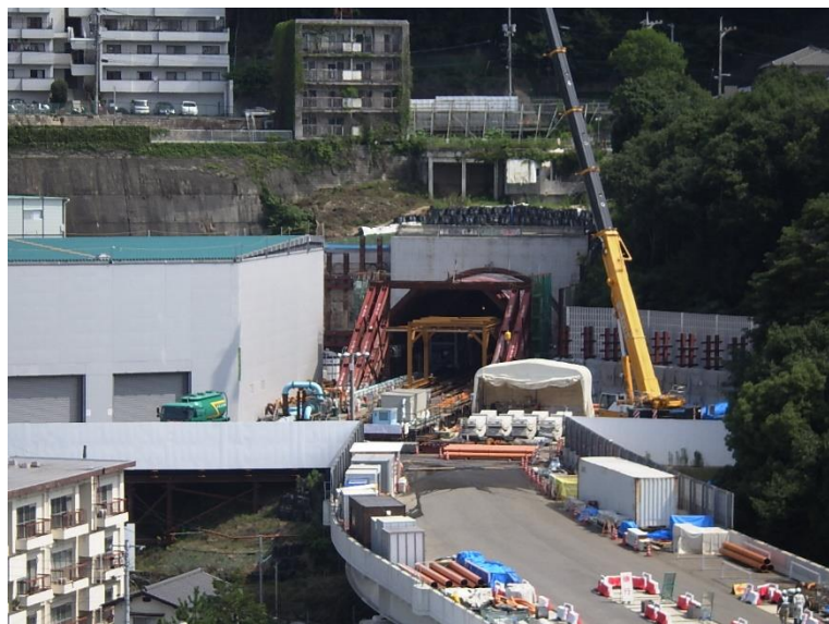
① 高速5号線シールドトンネル掘削他工事