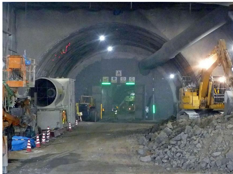
③ 高速5号線 NATM トンネル工事