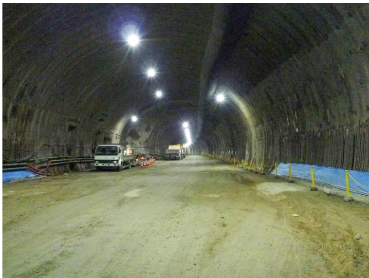
③ 高速5号線 NATM トンネル工事