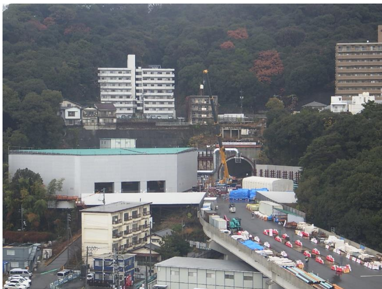
① 高速5号線シールドトンネル掘削他工事