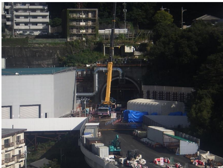
① 高速5号線シールドトンネル掘削他工事