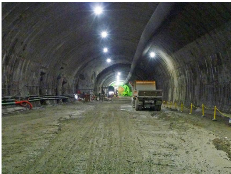
③ 高速5号線 NATM トンネル工事