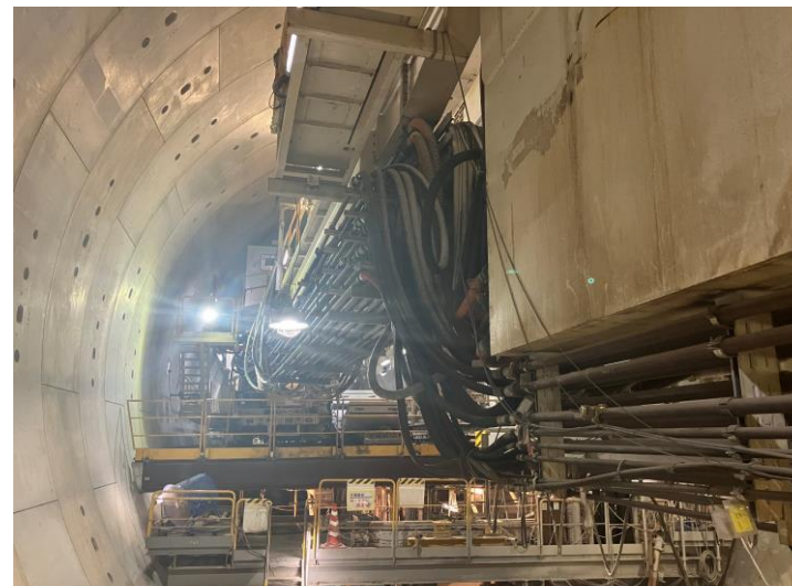
② 高速 5 号線シールドトンネル掘削他工事