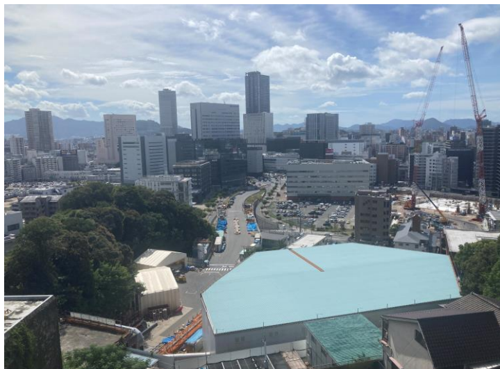
① 高速 5 号線シールドトンネル掘削他工事