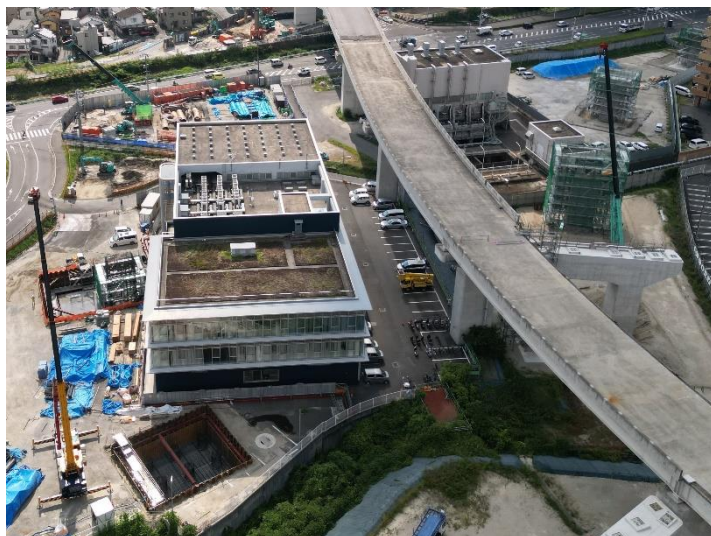
③ 広島高速 5 号線温品 JCT 下部工事 (1 工区)