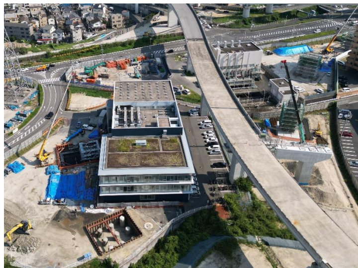
③ 広島高速 5 号線温品 JCT 下部工事 (1 工区)