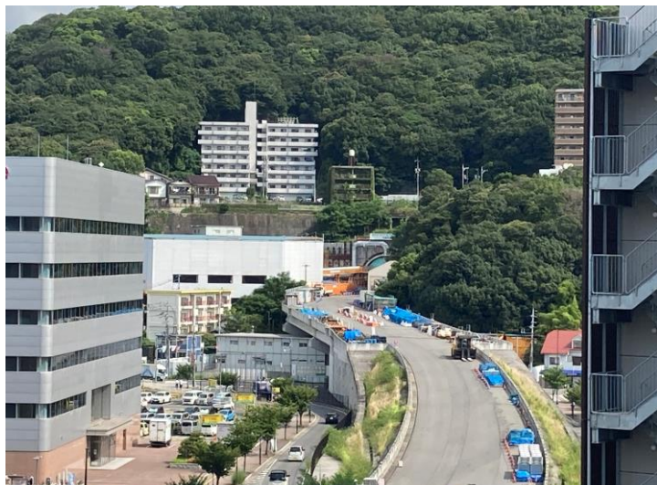
① 高速 5 号線シールドトンネル掘削他工事