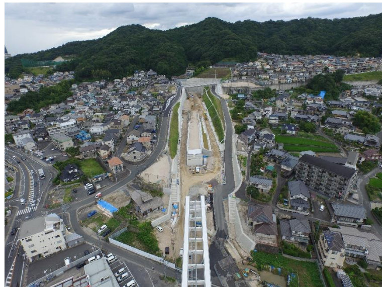
③ 高速5号線道路新設工事 (中山 I C)