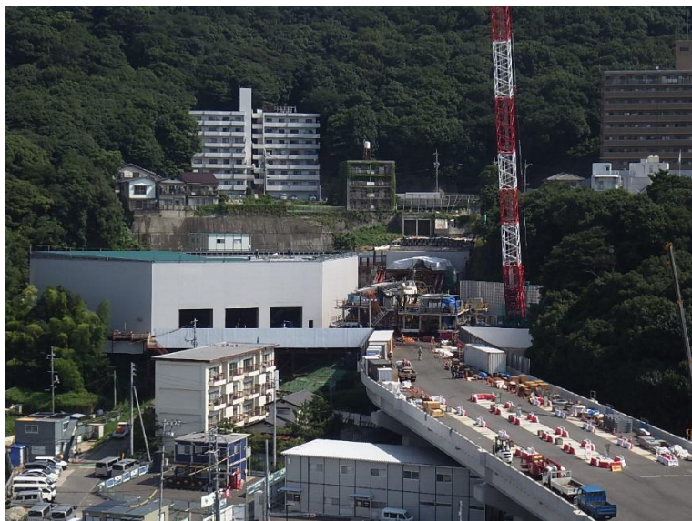
① 高速5号線シールドマシン製作他工事