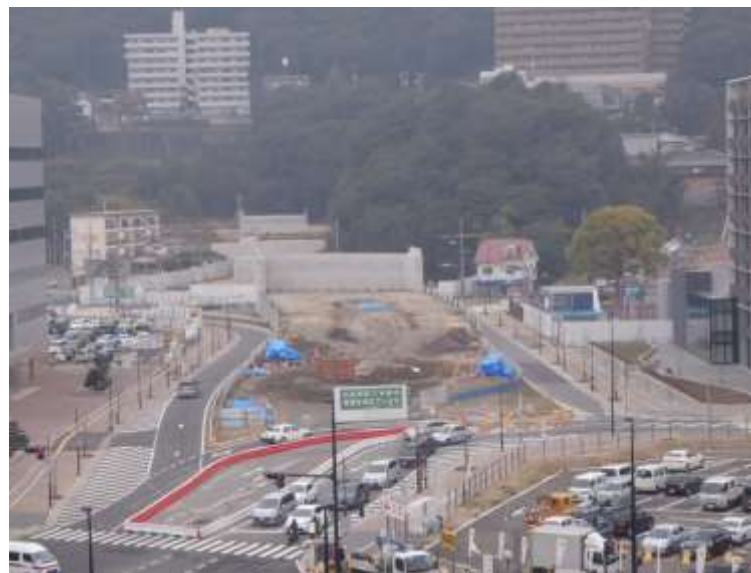
② 高速5号線下部工事 (二葉の里)