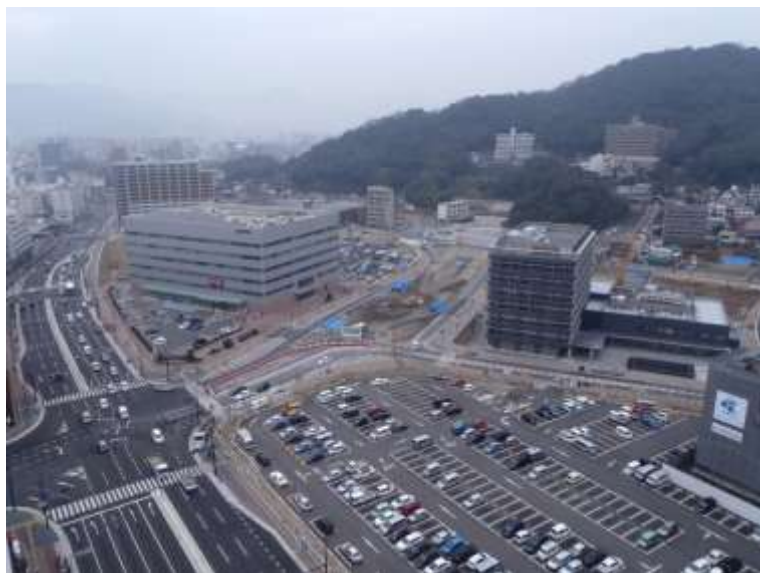
① 高速5号線下部工事 (二葉の里)