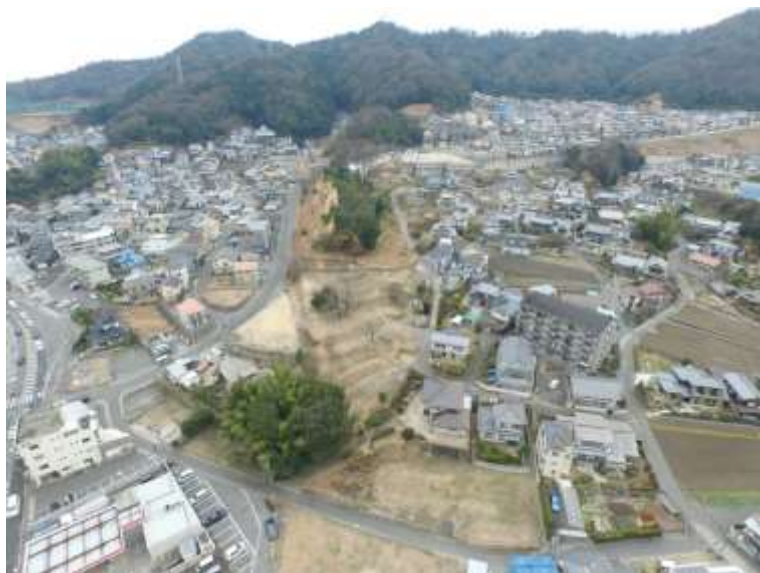
⑤ 高速5号線道路新設工事 (中山 IC)