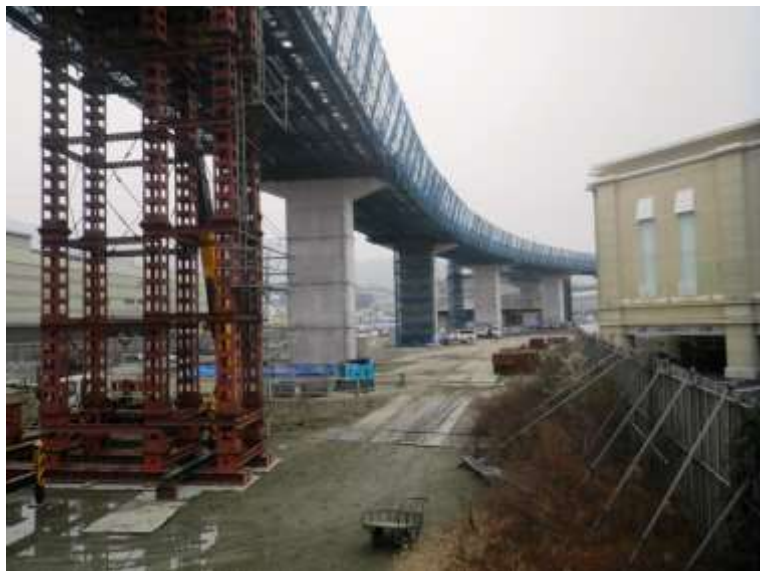
③ 高速5号線鋼上部工事 (温品 JCT)